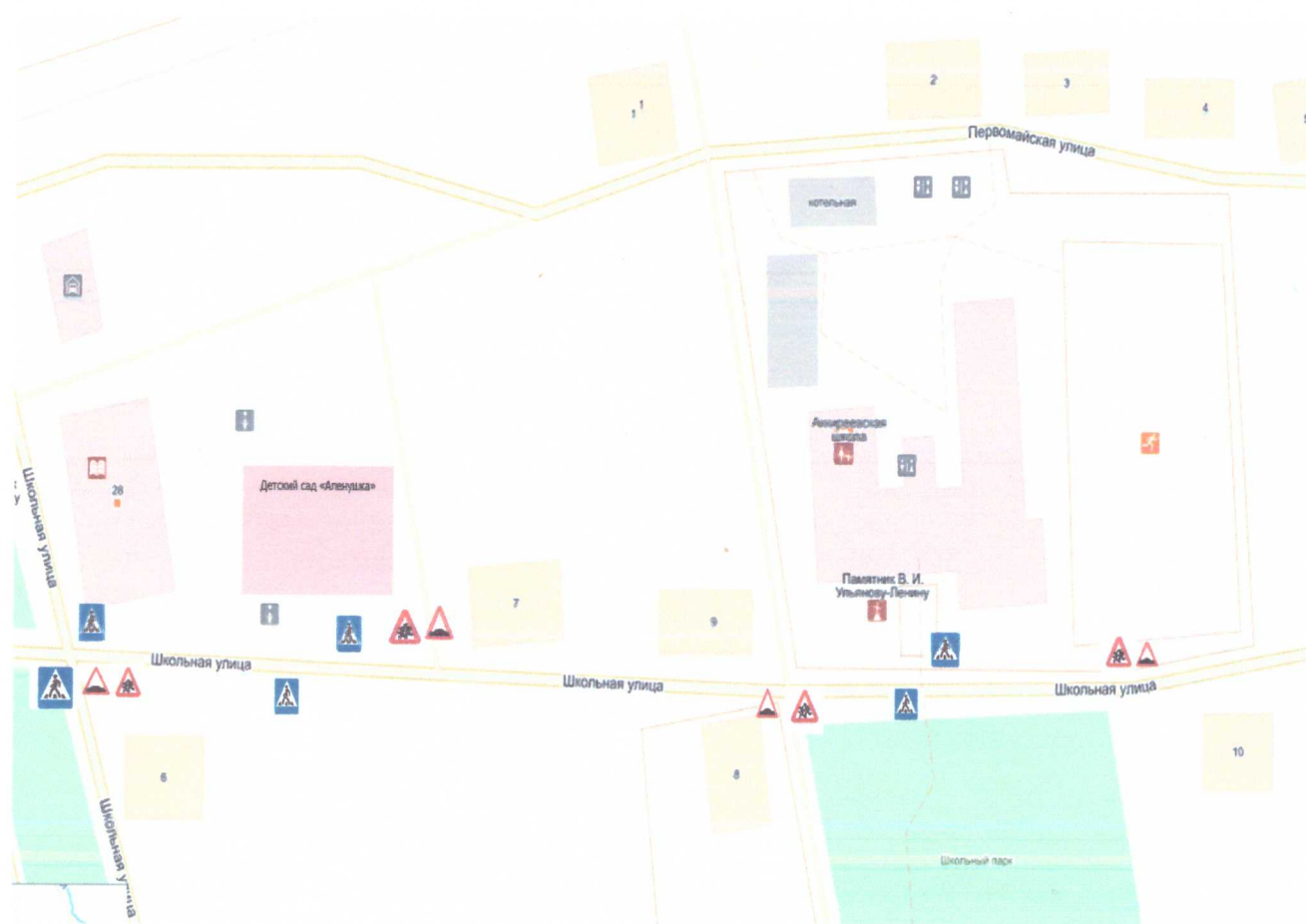
Схема организации дорожного движения в непосредственной близости от образовательного учреждения с размещением соответствующих технических средств организации дорожного движения, маршрутов движения детей. МБОУ «Аккиреевская СОШ» и МБДОУ «Аленушка»